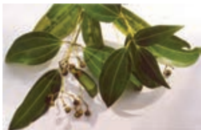
برگ و گل دارچین

گیاهان دارویی، تدخینی، ادویه ای: گیاهانی از تیره های مختلف هستند که به منظور استفاده از برخی مواد و ترکیبات آنها در تهیه دارو، دخانیات یا استفاده از عطر و رنگ و طعم آنها به عنوان ادویه کشت می شوند، مانند: توتون، خشخاش، خردل، زعفران، دارچین، زردچوبه، هل، گاوزبان، سنبل الطیب و غیره (شکل ۷-۲).